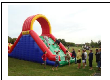
Onthaaldagen 1 ste jaar

Kies je voor Latijn? Sport? Wetenschappen? Wiskunde? Muziek? Handel? ICT? Bio - esthetiek? Techniek? Crea? Wij bieden het je allemaal op een actieve, creatieve en uitdagende manier!