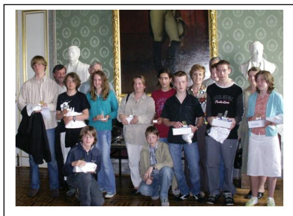
Prijsuitreiking op het koninklijk paleis. Onze school behaalde de 1 ste prijs in de Belgische kristalgroeiwedstrijd. Deze kristallen kweekten ze in de lessen wetenschappelijk werk fysica.