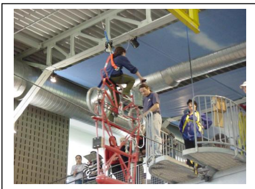
Uitstap naar Technopolis