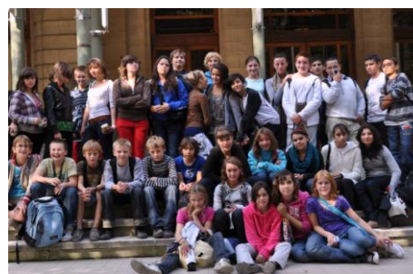
Uitstap naar de Zoo in Antwerpen